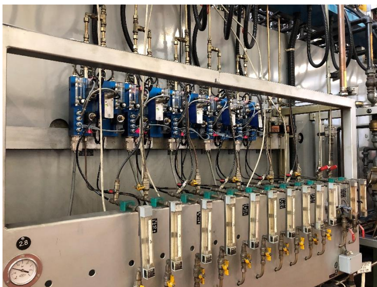
Steuerung von 5 C-Pegels Zonen über DM3 auf einer HTO.